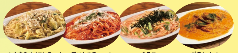
しらすのペペロンチーノ アマトリチャーナ タラコ グランキオ *フィオーレコースのみ