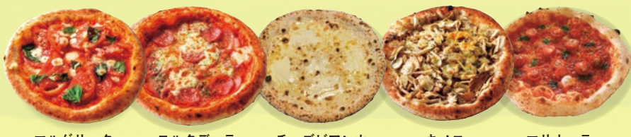
マルゲリータ モルタデッラ チーズビアンカ キノコ マリナーラ