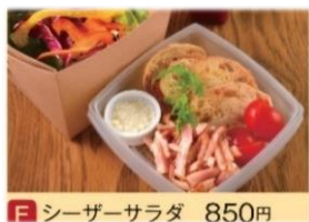
F シーザーサラダ 850円