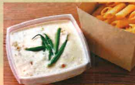
J カルボ風クリームペンネ 950 円