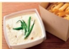
K カルボ風クリームペンネ 950円