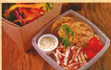
F シーザーサラダ 850 円

県産野菜たっぷりのサラダに濃厚ソースの Pasta やラザニアからていねいに手作りするスイーツまで定番のおすすめ商品です!