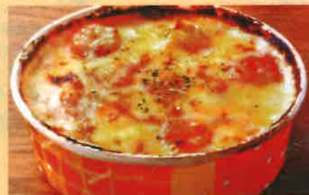
K ぶりぶり海老ドリア 900 円