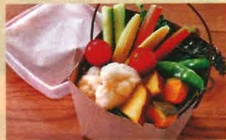
H ノラ風バーニャカウダ 1150 円