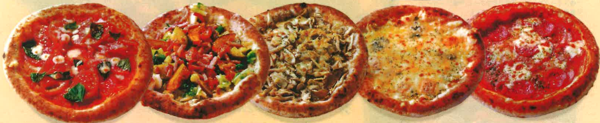
A 県産トマトのマルゲリータ