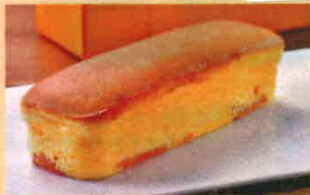
N スフレチーズケーキ 900 円