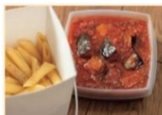
J ペンネ・ポロネーゼ 950円