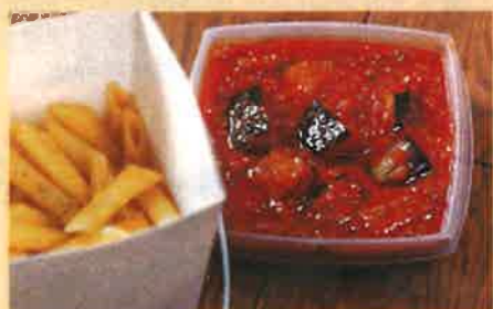
I ペンネ・ボロネーゼ 950 円