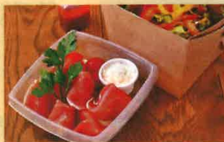
G 生ハムサラダ 990 円