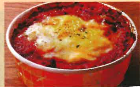
L ボローニャ風ラザニア 900 円