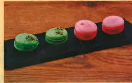
O マカロン 250 円