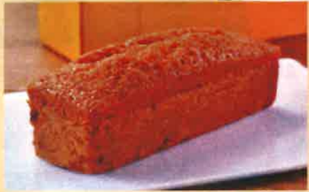
M キャラメルナッツケーキ 900 円