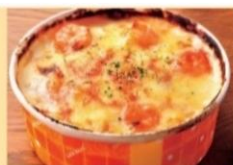
L ふりふり海老ドリア 900円