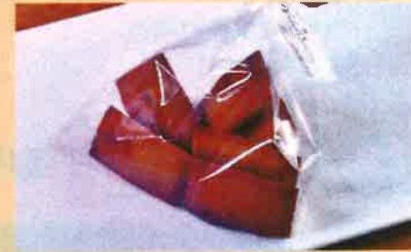
P フィナンシェ 200 円