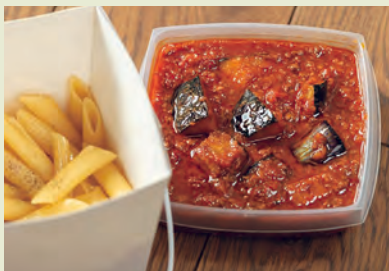
F ペンネ・ボロネーゼ 県産の旬野菜がたっぷり! 750円

県産野菜が入ったペンネに、濃厚ソースのドリヤとラザニア。 味もボリュームも大満足の逸品です!