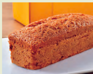
L キャラメルナッツケーキ リピーター続出の濃厚パウンドケーキ 750円