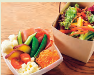
J スタンダードサラダ 県産野菜たっぷりのヘルシーサラダ 600円