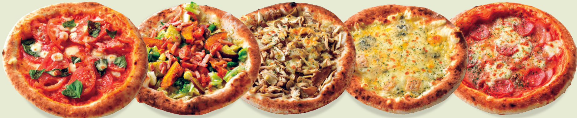
A 県産トマトのマルゲリータ