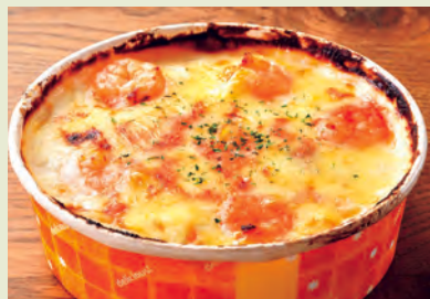
H ぷりぷり海老ドリヤ 大人も子どもも大好き! 700円