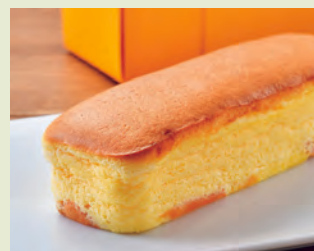
M スフレチーズケーキ しっとりふわふわの食感が大人気! 750円