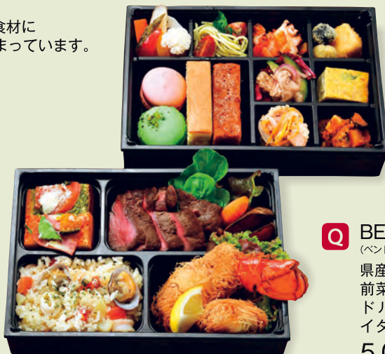
Q BENTO PIENO (ベント ピエーノ) 県産牛やオマール海老! 前菜からメインさらにドルチェまで入ったイタリアコース弁当 5,000円

ご注文は、お電話または店舗にて承ります。商品名と数量をスタッフにお伝えください。