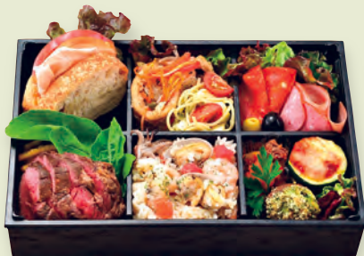
P BENTO CENTRO (ベント チェントロ) ナチュラルビーフや生ハムのパニーノ、ティエツラなどボリューム満点のお弁当 2,000円