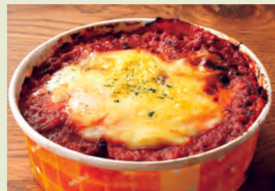
I ボローニャ風ラザニア 濃厚なミートソースとホワイソース 700円