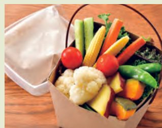
K ノラ風バーニャカウダー Nora といえばこれ! 1,000円