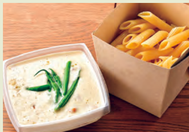
G カルボ風クリームペンネ うま味たっぷりのカルボ風ソース 750円