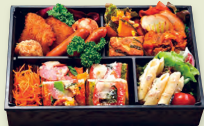
O BENTO BUONO (ベント ブオノ) お手軽イタリアン弁当 1,200円